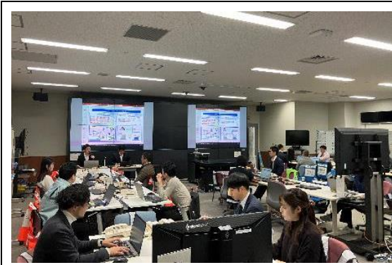
座学（事前説明会）の様子（大阪府）