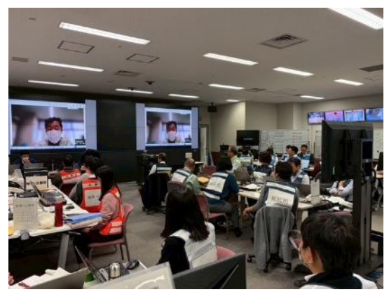
八尾市担当者による講評の様子（大阪府）