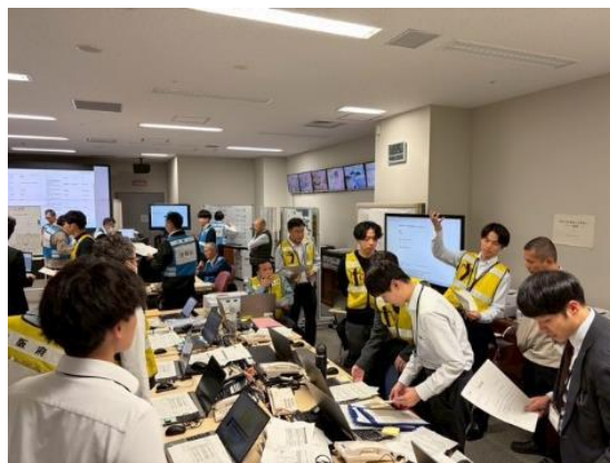
対策本部の活動（大阪府）