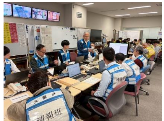
対策本部の活動（大阪府）