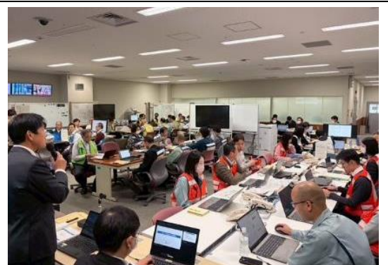
訓練前全般説明の様子（大阪府）