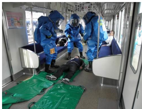
列車内で要救助者の救助に当たる寝屋川消防署の隊員