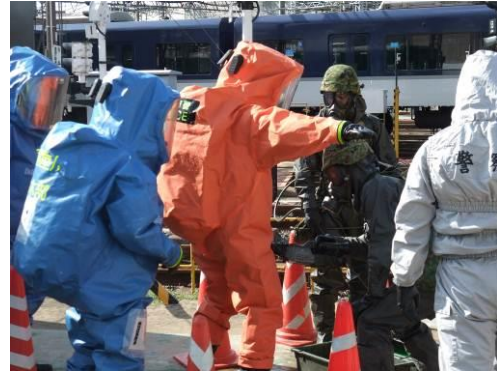
列車内での活動を終えた消防・警察隊員の除染に当たる自衛隊員の除染に当たる自衛隊員