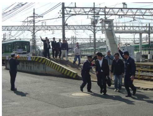
被災列車入線前にホームの乗客を避難誘導する寝屋川警察署員と駅係員