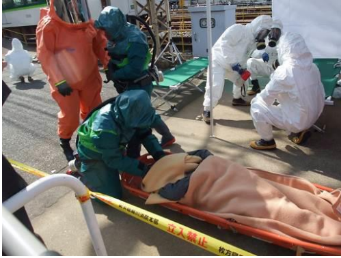
除染前トリアージ及び医療活動に従事するDMATの隊員