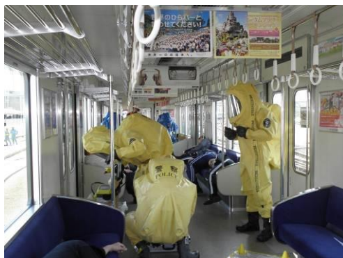
列車内で、化学剤の簡易検知と採取を行う大阪府警察本部の隊員