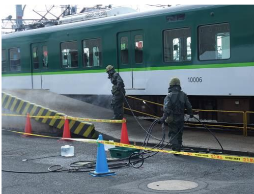
汚染地域の除染に当たる自衛隊員