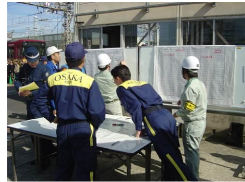
関係機関の円滑な連携確保のため、現地調整所で対応を協議・調整する各機関代表者