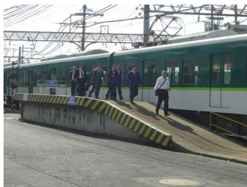
駅に到着した被災車両から避難する乗客