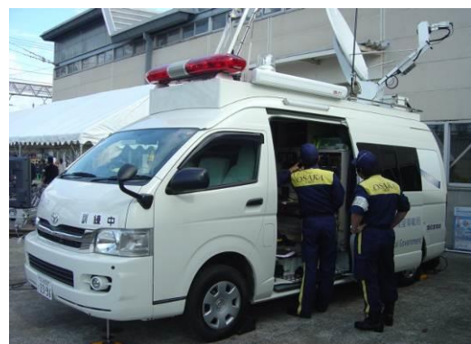
災害現場の映像を本部に送信する大阪府衛星通信車