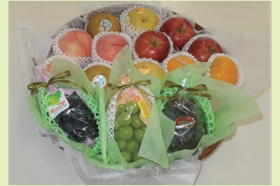
※イメージ