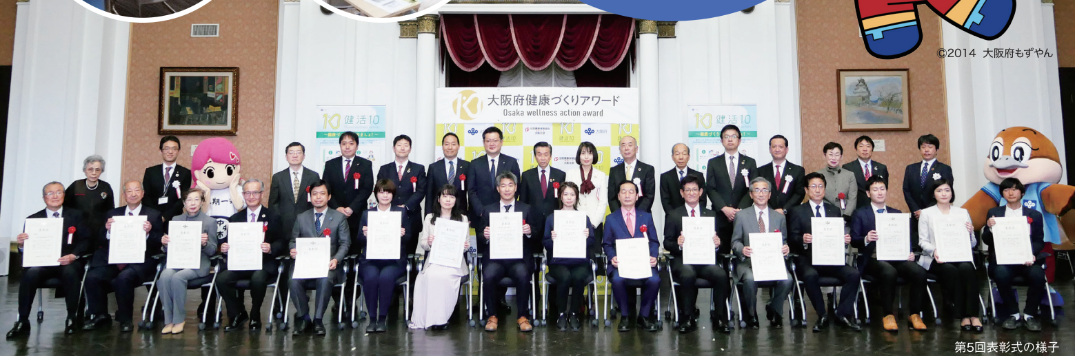
第5回表彰式の様子