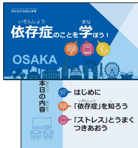
依存症予防啓発ツール

日 時 令和5年12月27日(水) 午後1時30分から午後4時30分まで ( 受付 : 午後1時から )