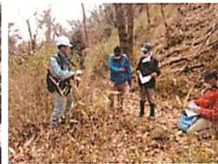
【島本町】森林境界の画定(R3～)