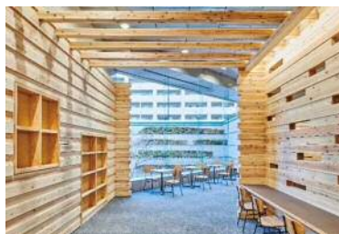
大阪府立中央図書館1階 (R3)