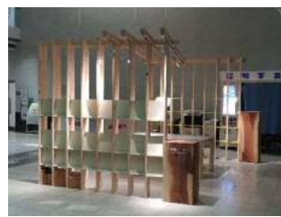
【河内長野市】市庁舎1階の木質化(R1) ※すべて大阪府産材を使用