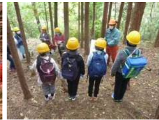
【河内長野市】小学校での森林体験授業(R1～)