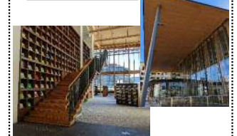
【吹田市】公民館・図書館等複合施設(R4竣工) ・吹田市と能勢町とのフレンドシップ協定(H17)に基づき、施設の屋根(OLT)、壁、内装等に能勢町産材を使用(譲与税を活用)