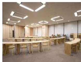
【大阪市】市立中央図書館の木質化(R2) ※すべて大阪府産材を使用