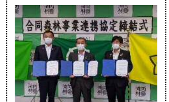
・石川流域の水資源保全に向け、上流域の3市町村が連携し、下流域の市町村との森林整備や河内材活用の取組みを目指す