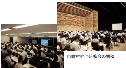
市町村向け研修会の開催