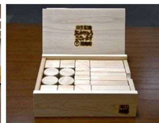
【河南町】出生記念木製玩具(積木)の配付(R3～) ※すべて大阪府産材を使用