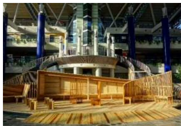
大阪府咲洲庁舎1階 フェspa (R3)