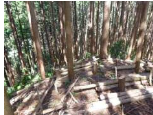
【千早赤阪村】条件不利森林での間伐(R2～)