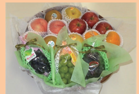
※イメージ