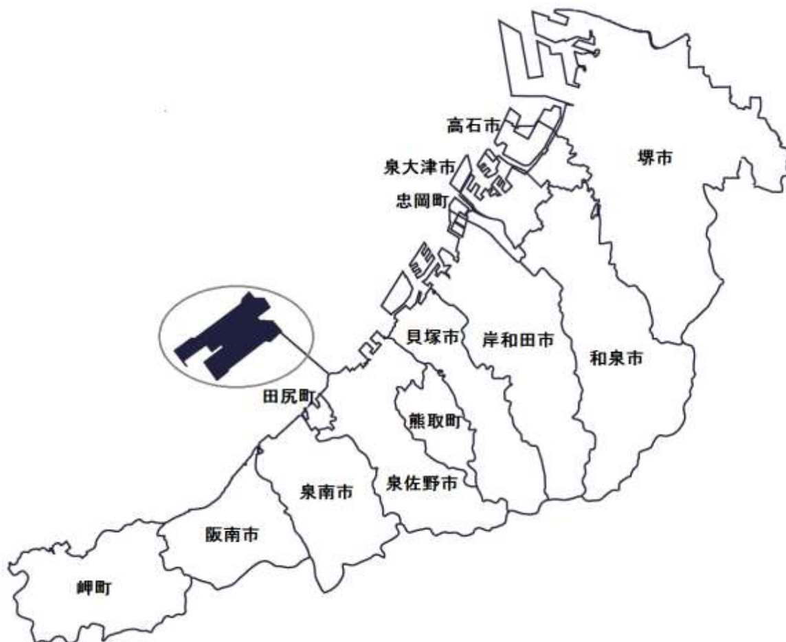
図1-1 関西国際空港の位置