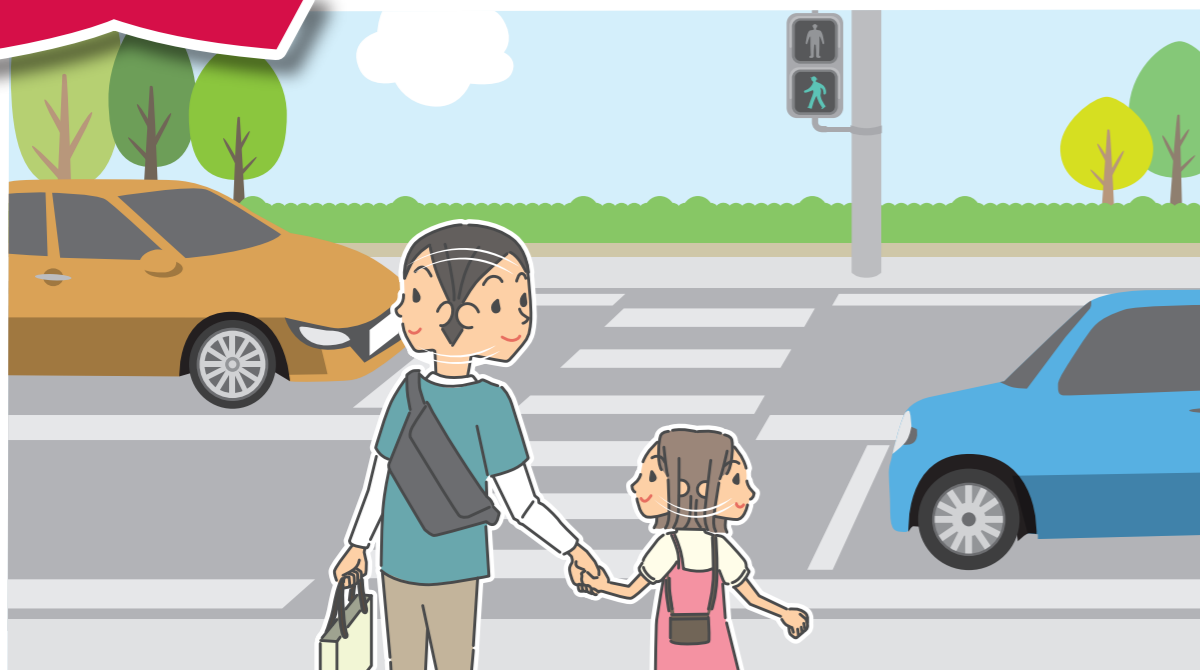
こどもの交通事故防止