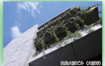
(一社)ランドスケープコンサルタンツ協会関西支部長賞