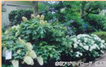
(公財)国際花と緑の博覧会記念協会会長賞