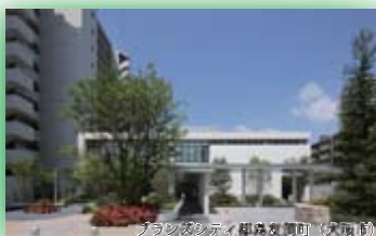
(一社)ランドスケープコンサルタンツ協会関西支部長賞