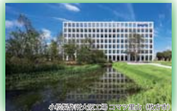
(公財)国際花と緑の博覧会記念協会会長賞