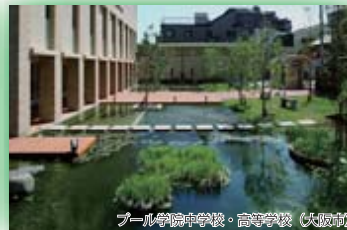
(公財)国際花と緑の博覧会記念協会会長賞