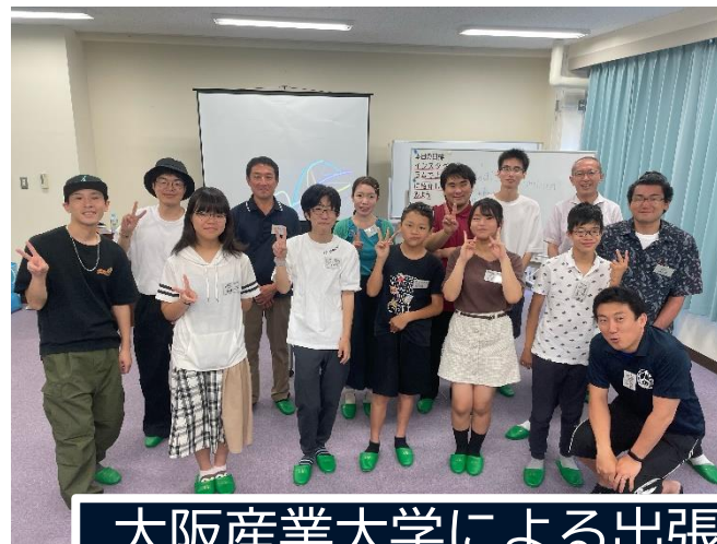
大阪産業大学による出張講座