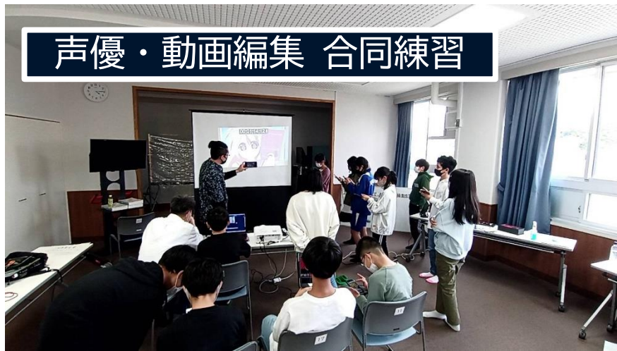
声優・動画編集 合同練習