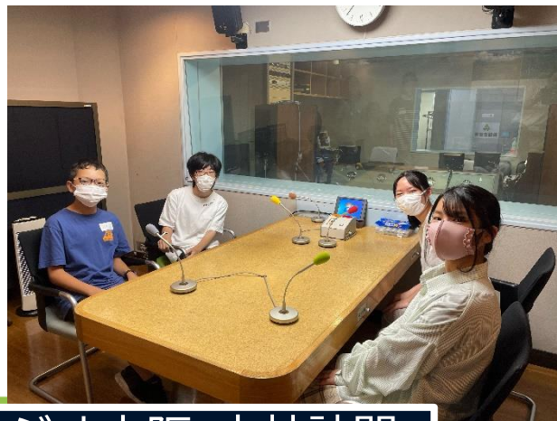
ラジオ大阪 本社訪問