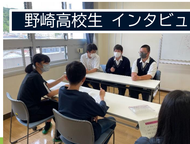
野崎高校生 インタビュー動画撮影