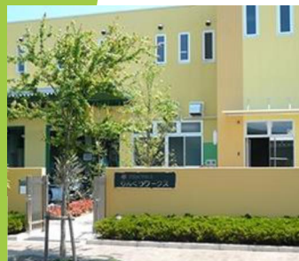
理念:ただ、ひたすら、人のために