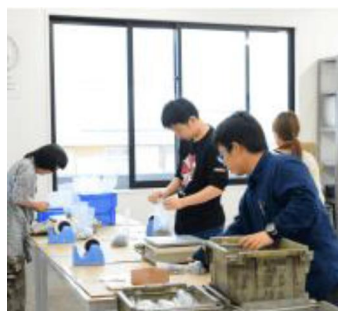
特色:発注先に準じた職場環境