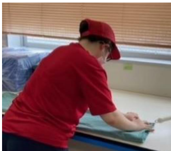
特色:意欲・能力に応じた評価