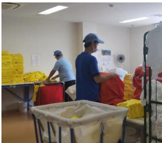
作業内容:クリーニングたたみ仕上