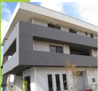
理念:ともに歩み、楽しくくらす