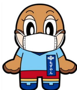
マスク着用 (ちゃくよう)

URL http://www.pref.osaka.lg.jp/shogaishajiritsu/jiritsu01/index.html