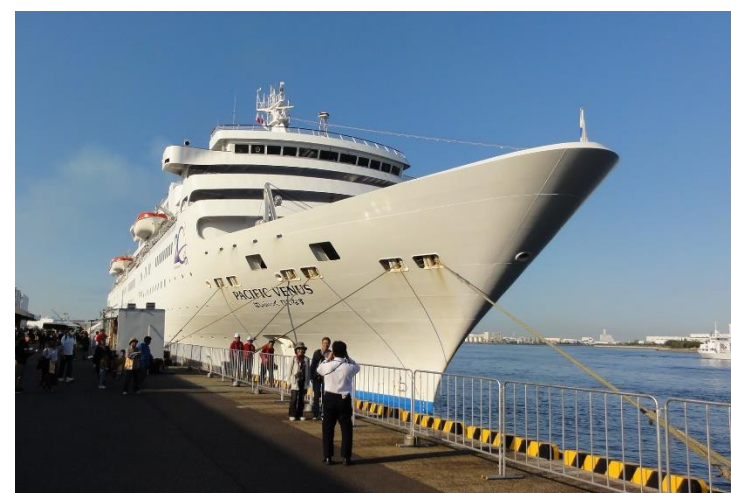
【堺泉北港大浜埠頭第5号岸壁】