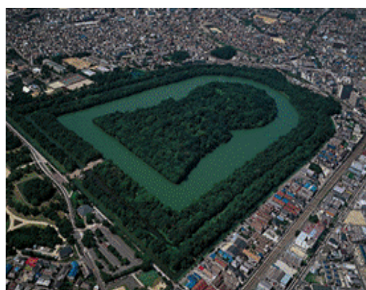
【世界文化遺産「百舌鳥・古市古墳群」】

府域の多様な観光素材を活かし、大阪府域全体へのクルーズ客船の乗客の訪問促進、クルーズ客船寄港による観光振興・地域活性化を図ります。