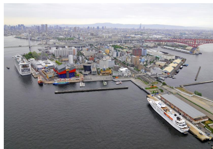
【中央突堤北岸壁(手前)】