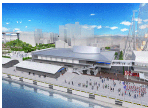
【新ターミナルのイメージ図】