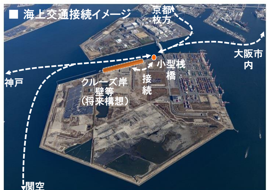
【大阪港(夢洲)を中心とした海上交通ネットワーク(イメージ)】

さらに、夢洲の小型栈橋に隣接してクルーズ客船用岸壁を整備した場合には、小型旅客船による関西国際空港との接続によって「フライ&クルーズ」の促進が期待でき、また神戸や大阪市内との接続によって、クルーズ客船の乗客への多様なオプションツアーの提供やエクスカージョン※の利便性向上につなげることが可能となります。