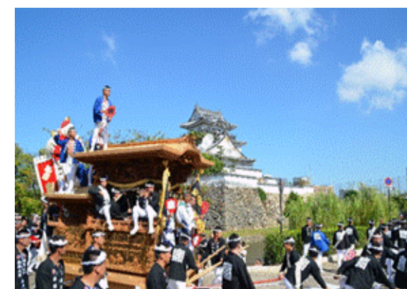
【岸和田だんじり祭】