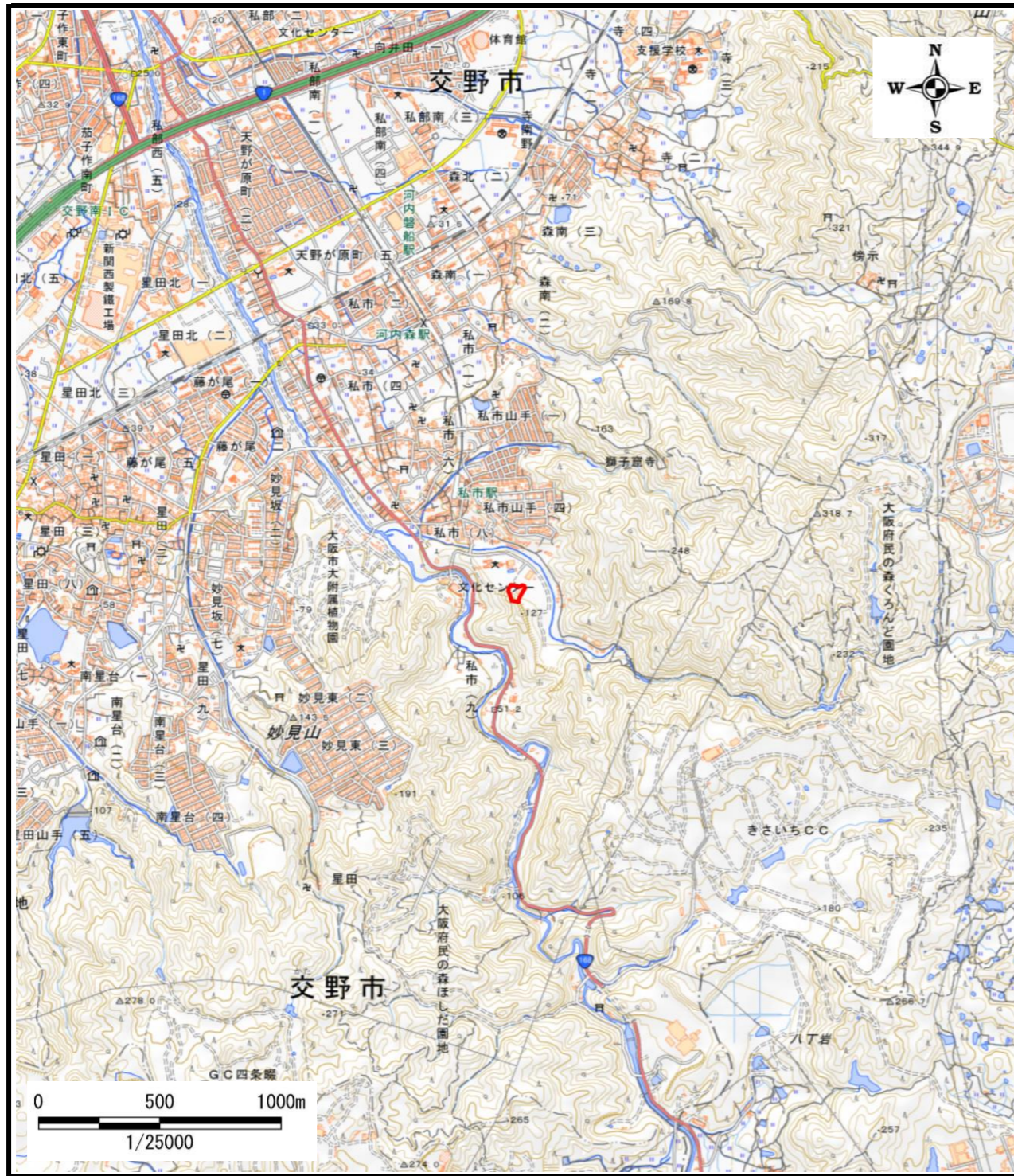
区域指定箇所概略位置図(1/25,000)