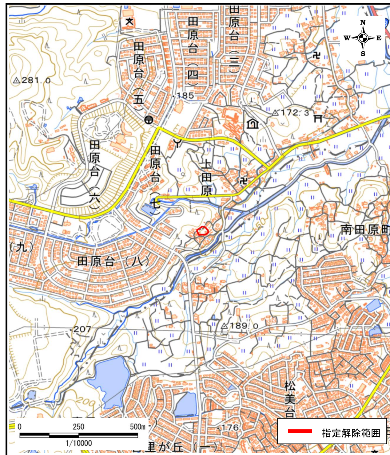
区域指定箇所位置図(1/10,000)