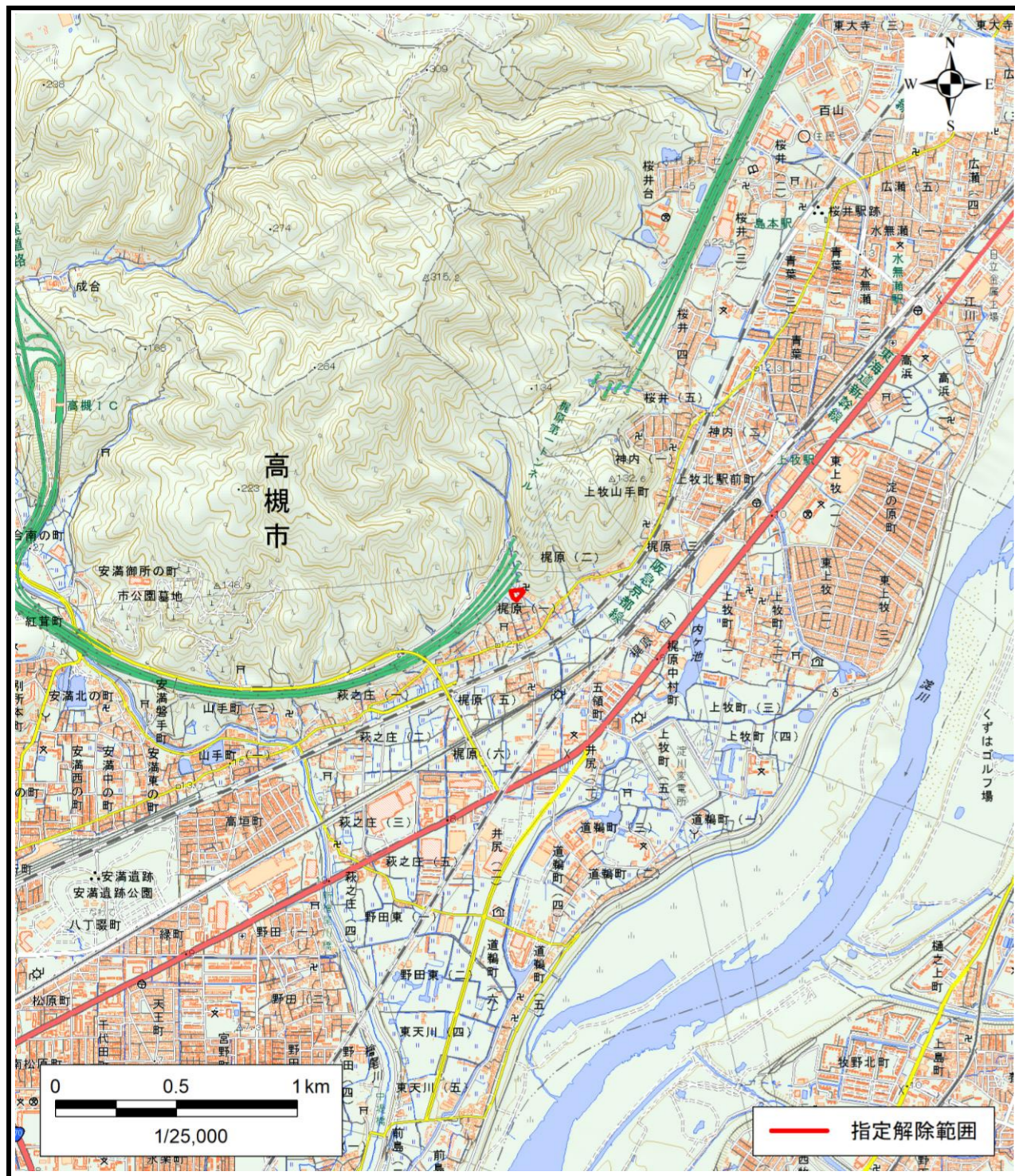
区域指定解除箇所概略位置図(1/25,000)