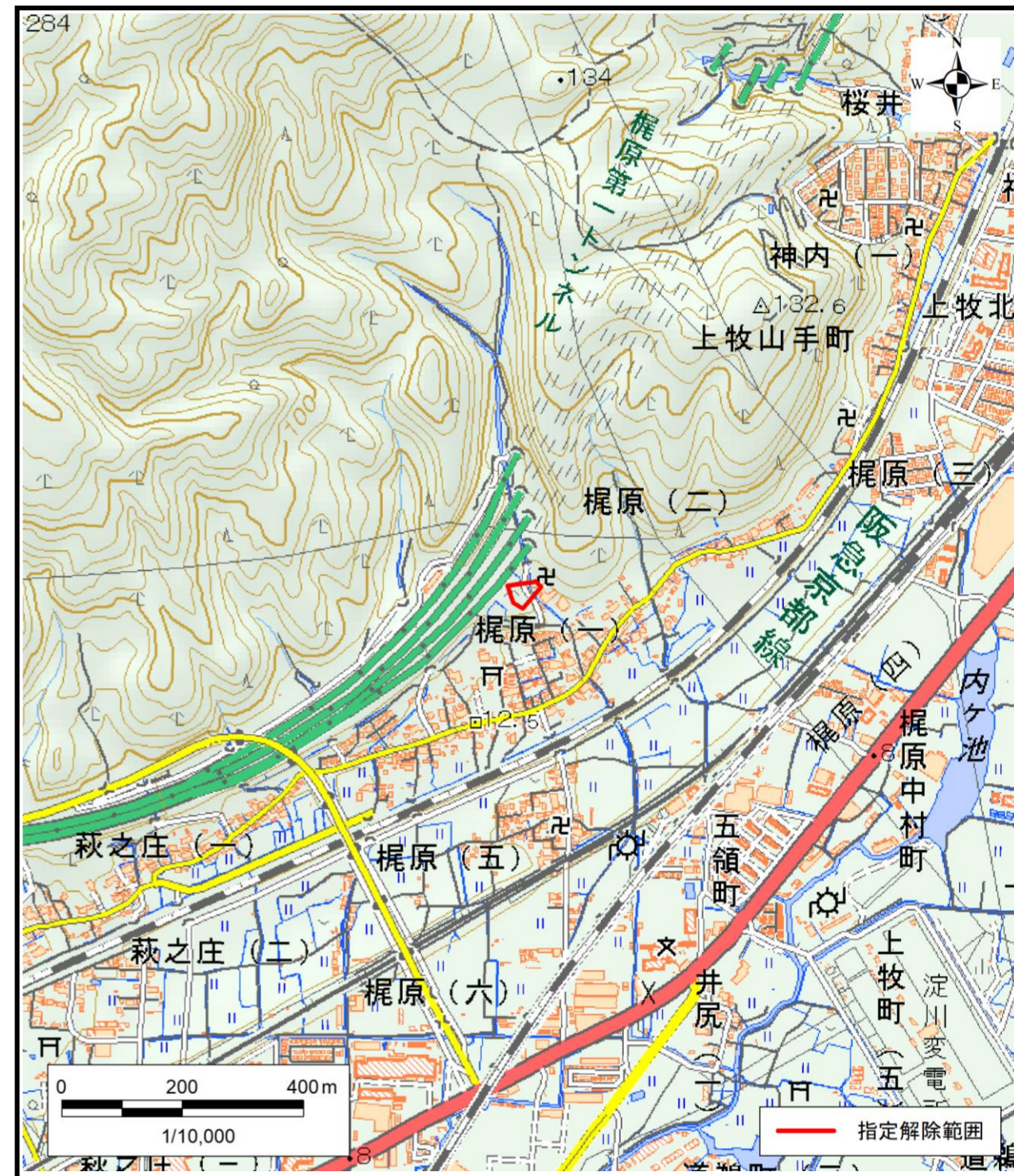
区域指定解除箇所位置図(1/10,000)