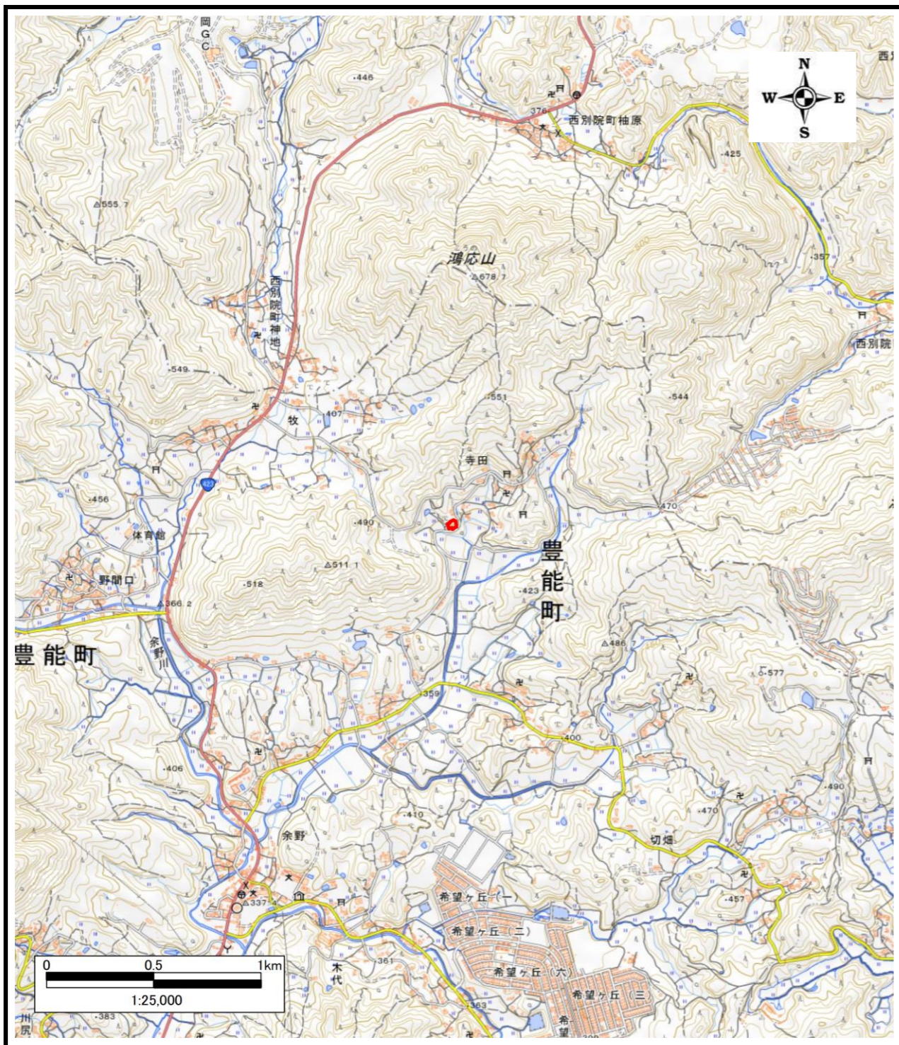
区域指定箇所概略位置図(1/25,000)