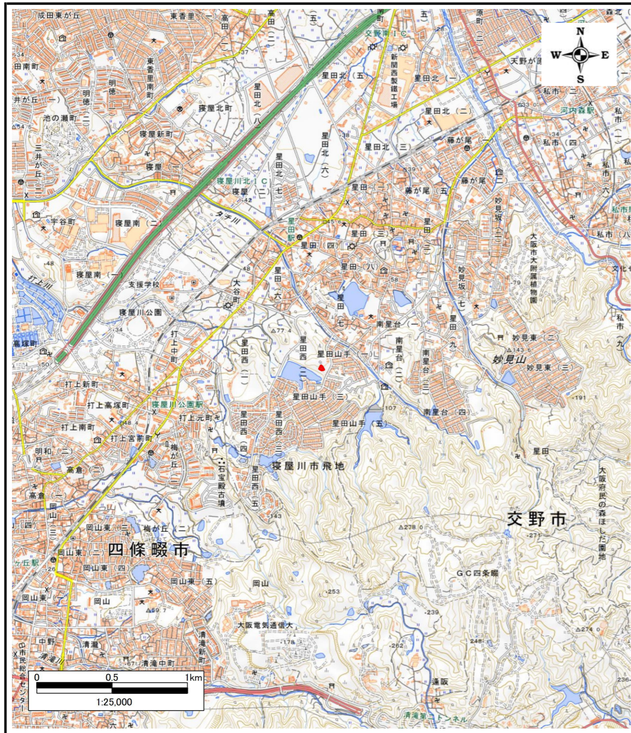
区域指定箇所概略位置図(1/ 25,000)