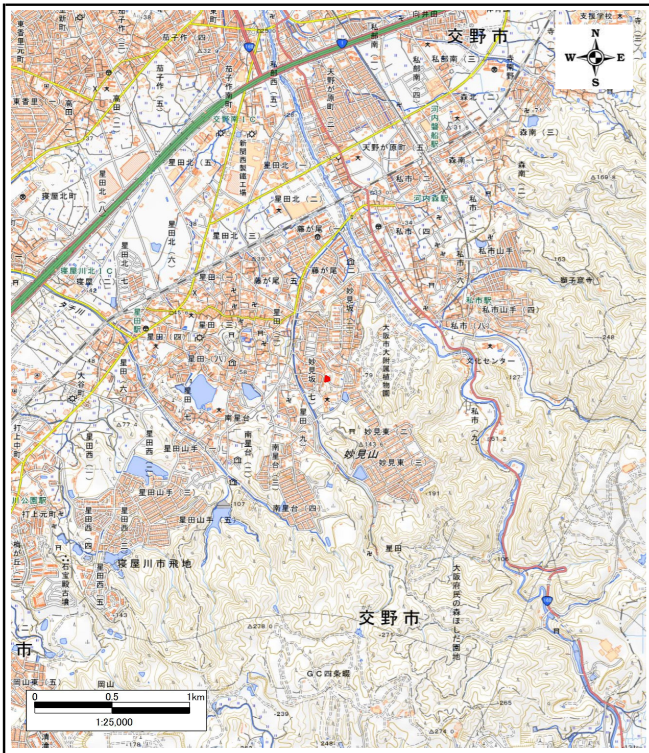
区域指定箇所概略位置図(1/ 25,000)