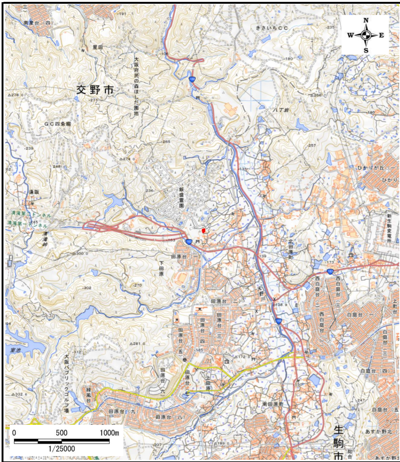
区域指定箇所概略位置図(1/25,000)