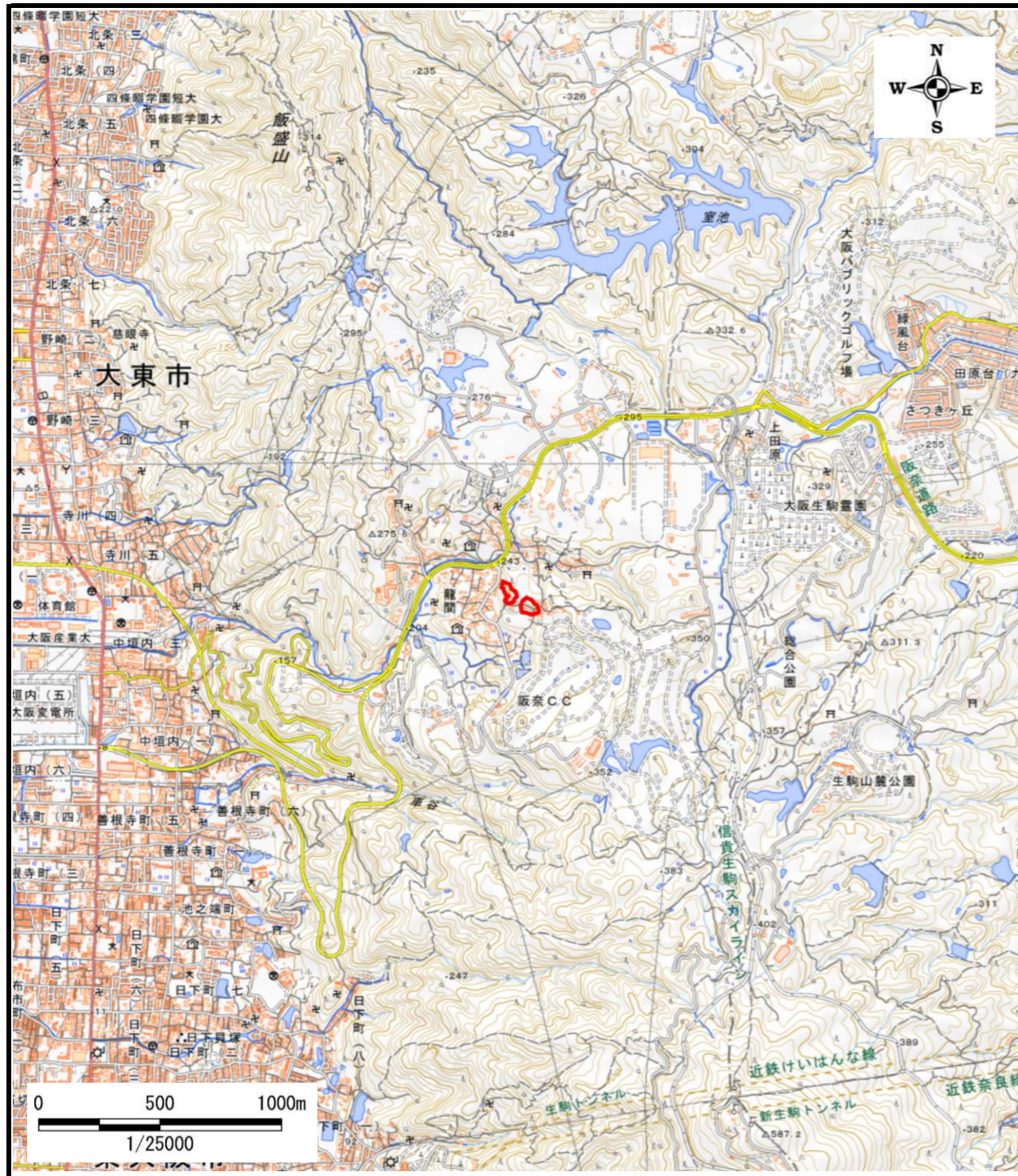
区域指定箇所概略位置図(1/25,000)