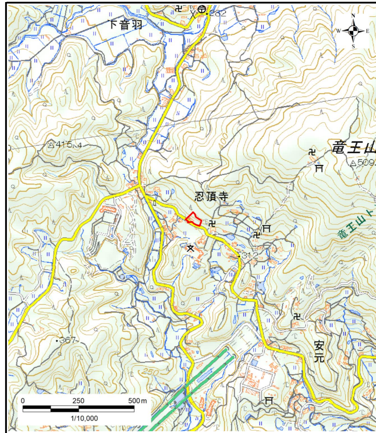
区域指定箇所位置図(1/10,000)