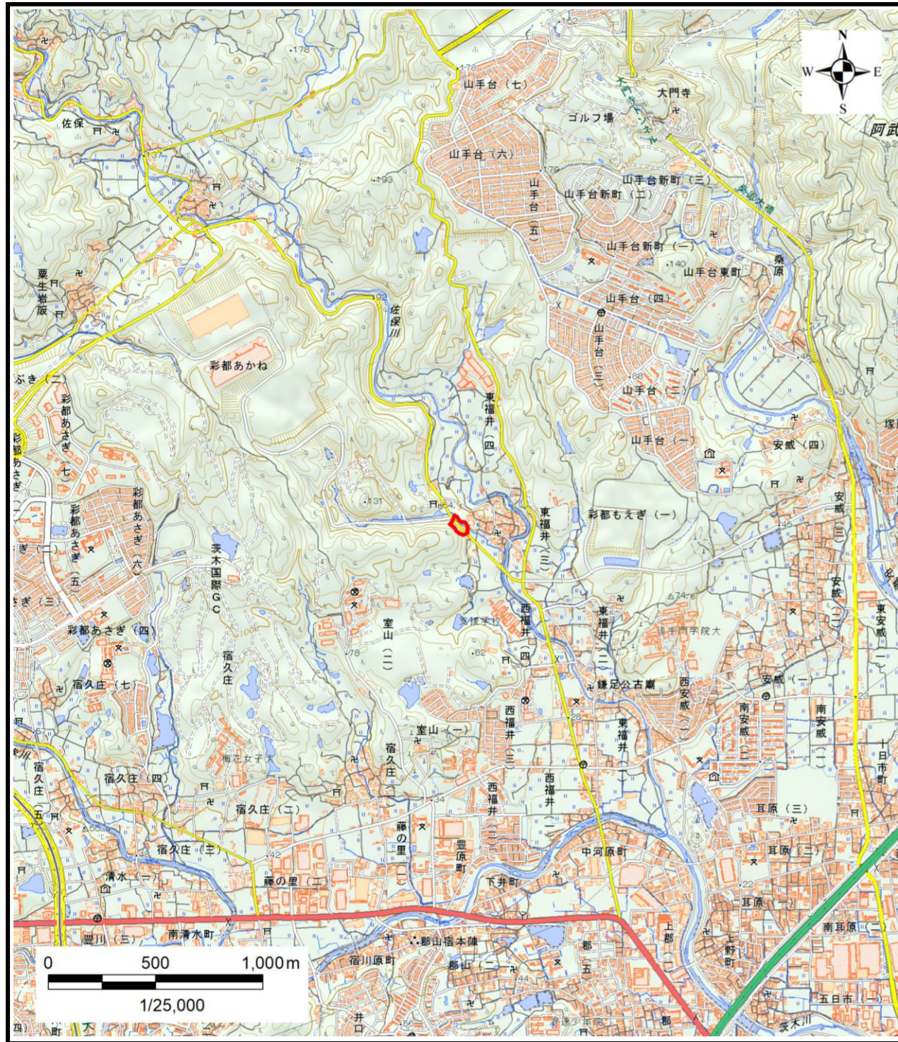
区域指定箇所概略位置図(1/25,000)