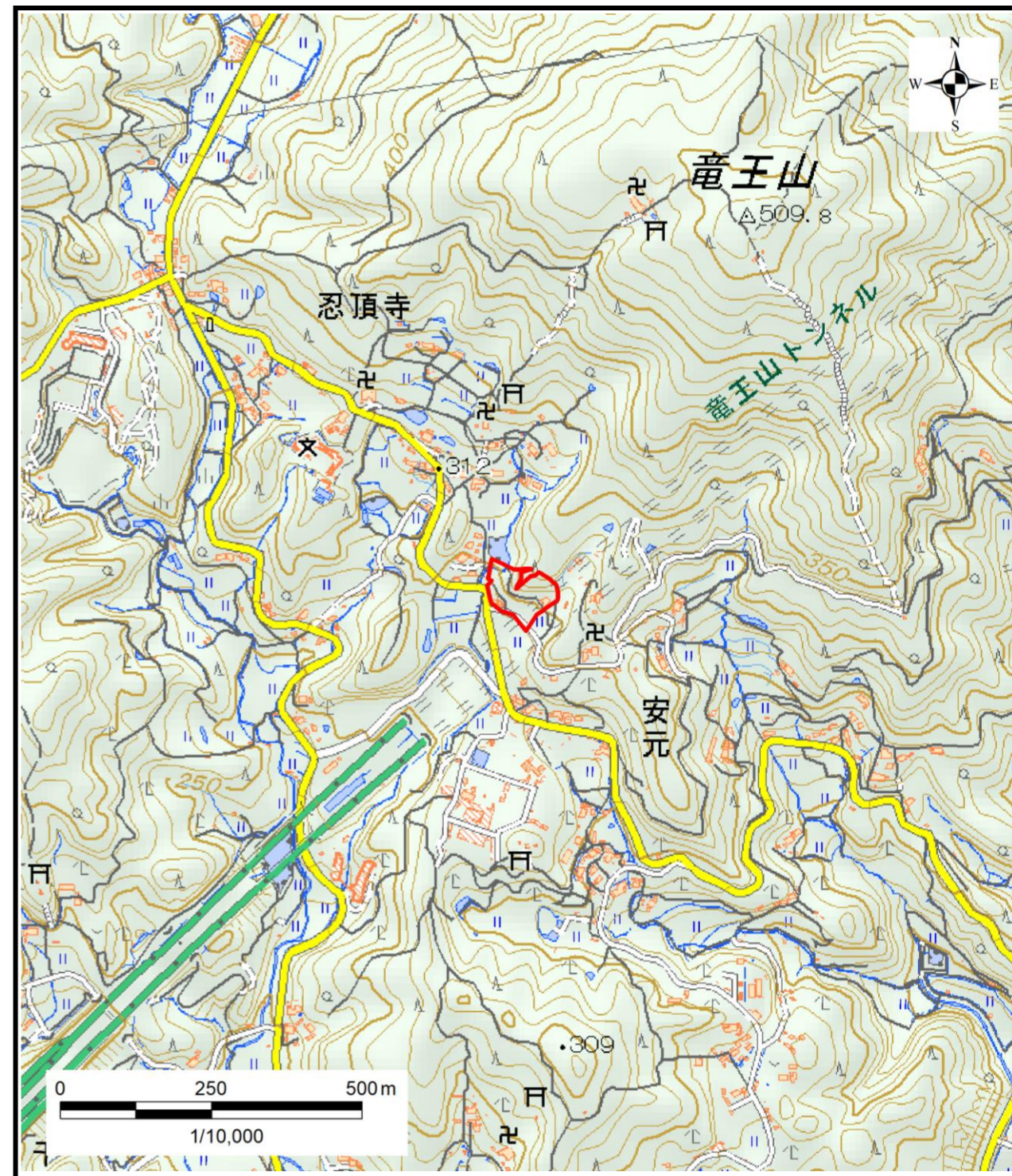
区域指定箇所位置図(1/10,000)