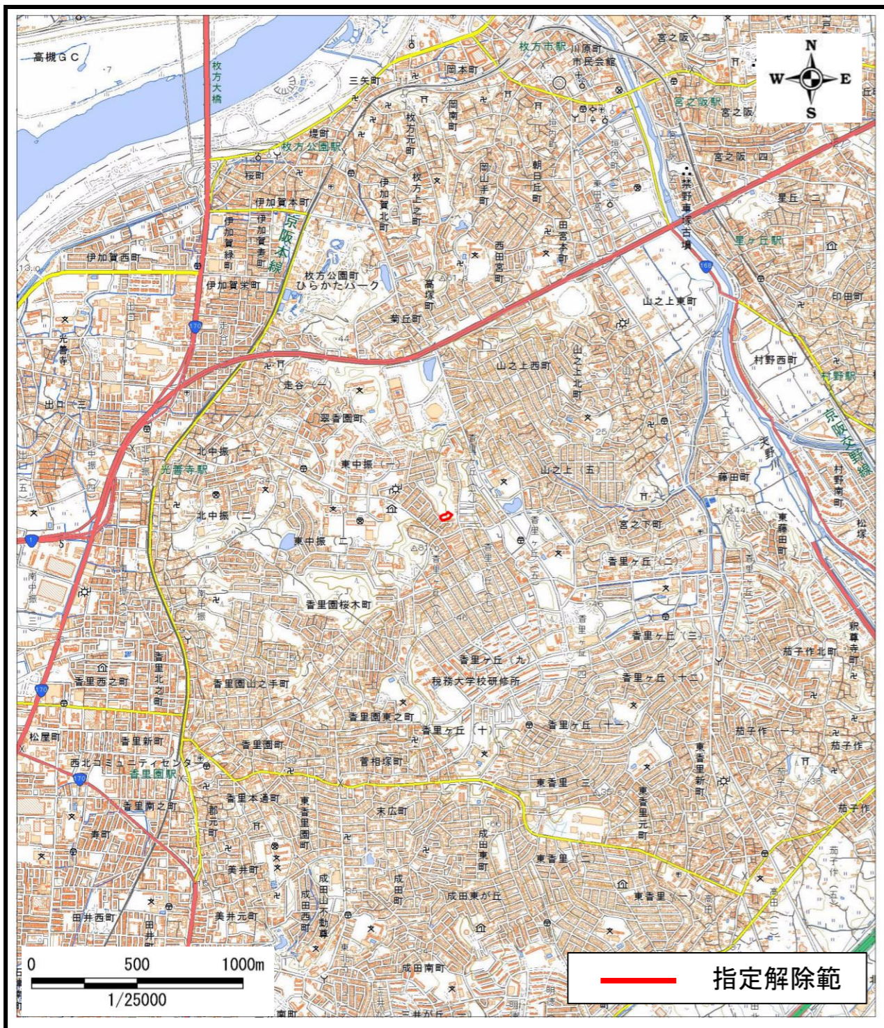
区域指定箇所概略位置図(1/25,000)