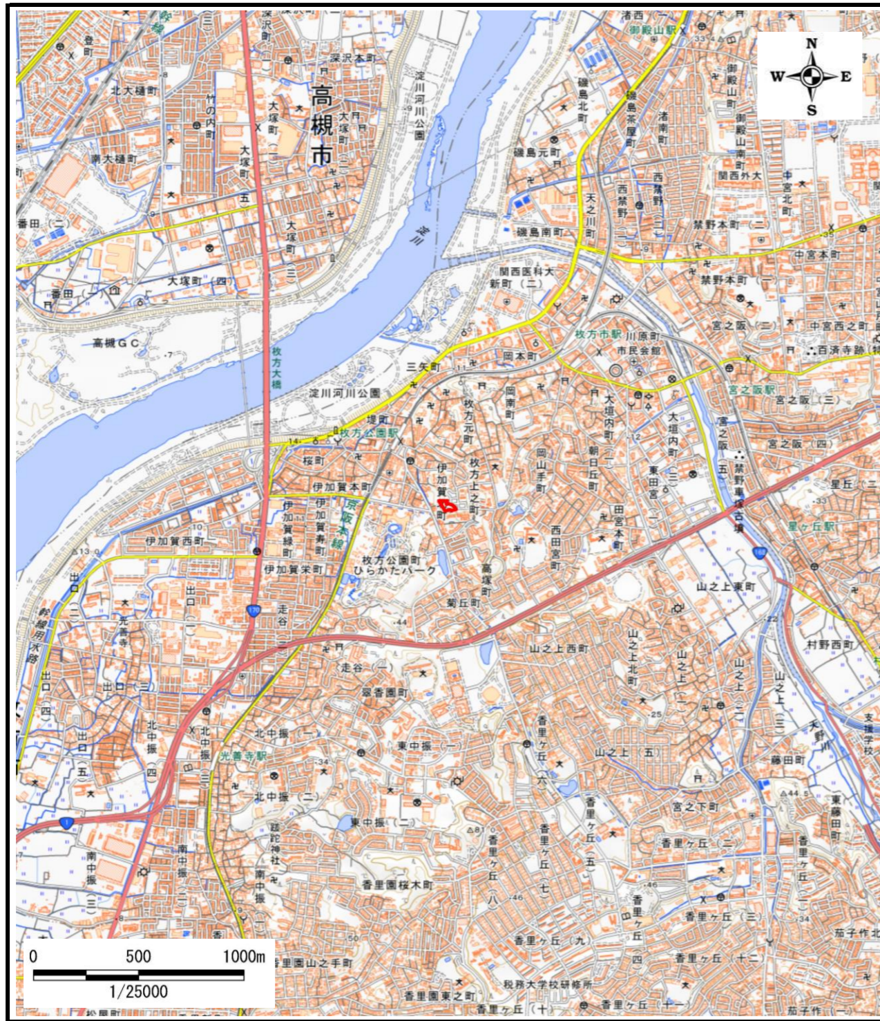
区域指定箇所概略位置図(1/25,000)