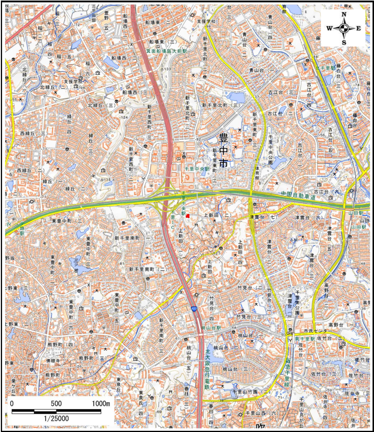
区域指定箇所概略位置図(1/25,000)