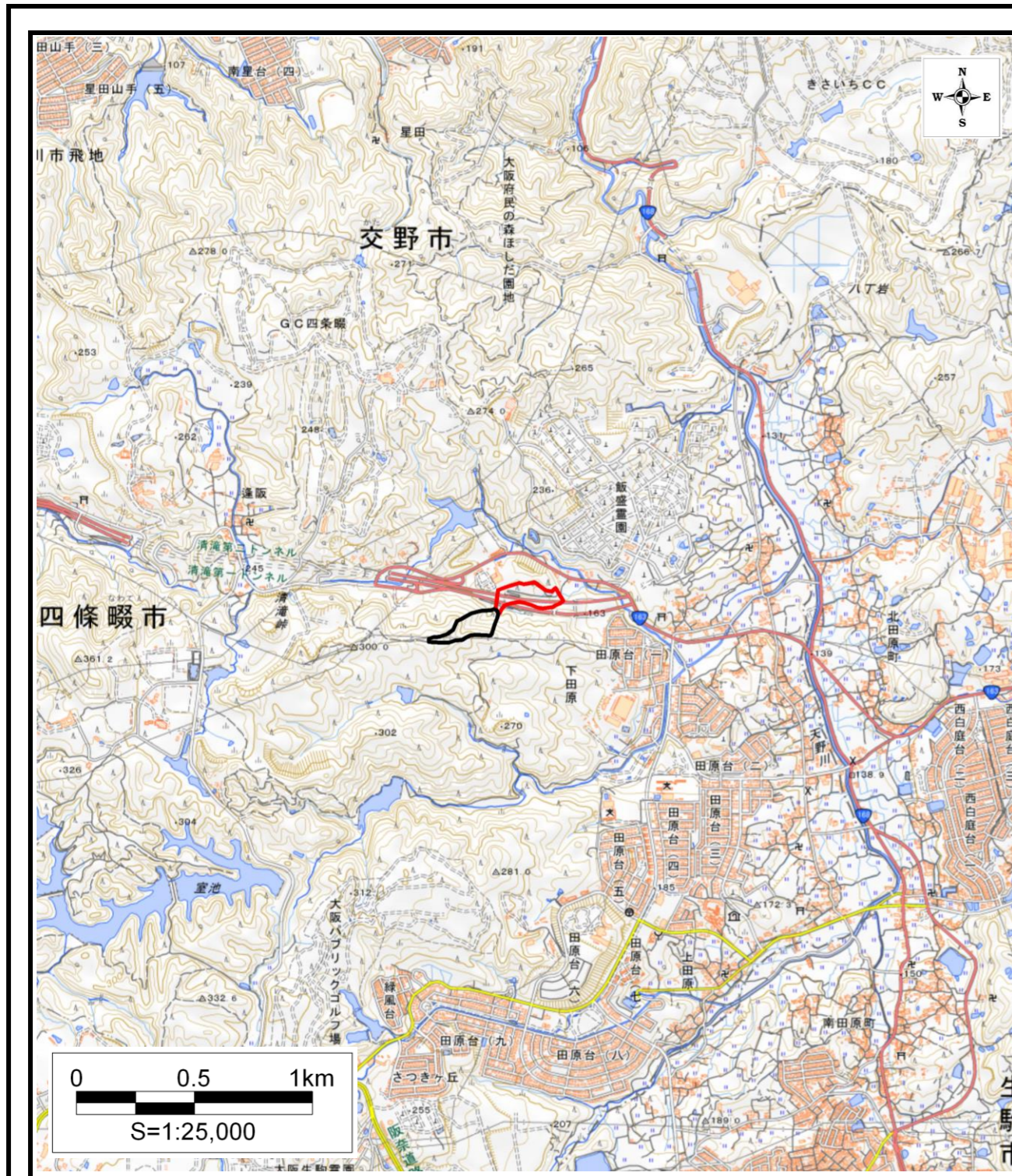
区域指定箇所概略位置図(1/25,000)