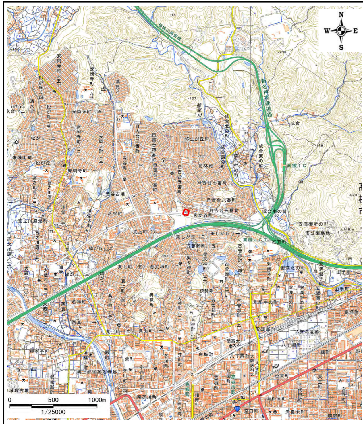
区域指定箇所概略位置図(1/25,000)