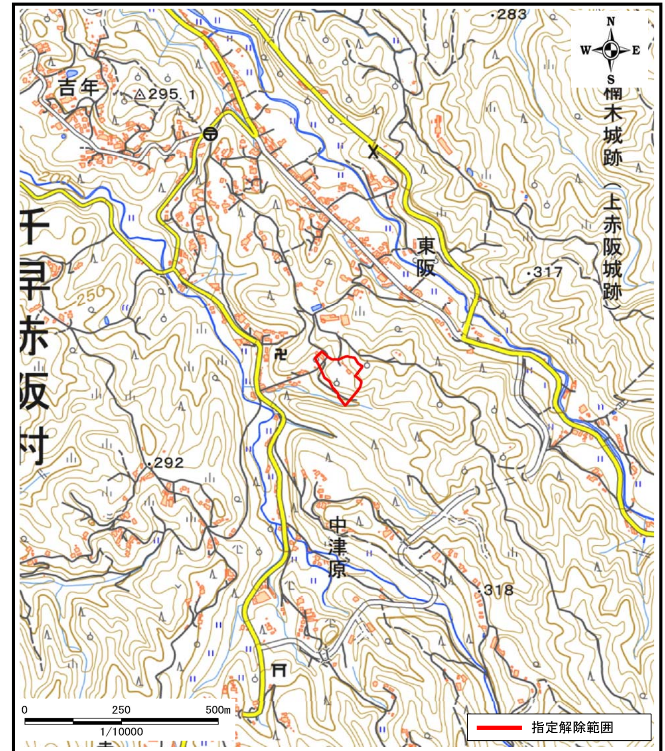
区域指定箇所位置図(1/10,000)