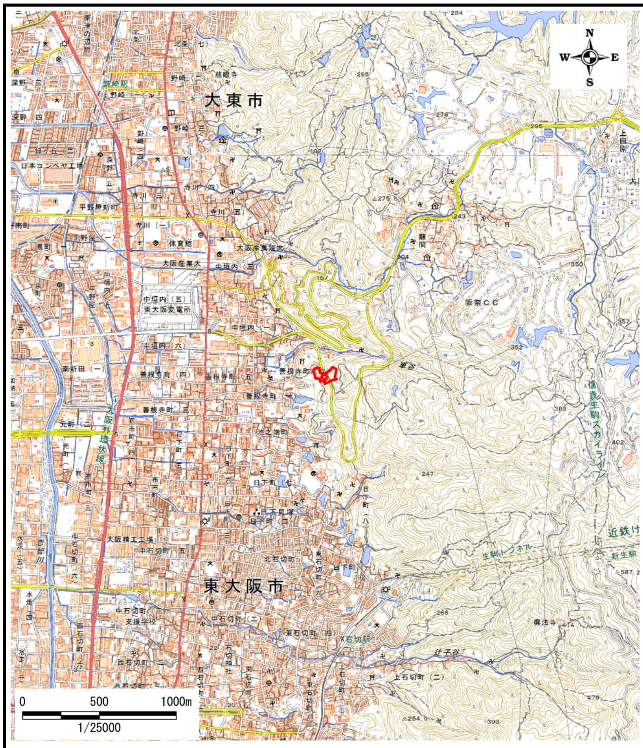
区域指定箇所概略位置図(1/25,000)