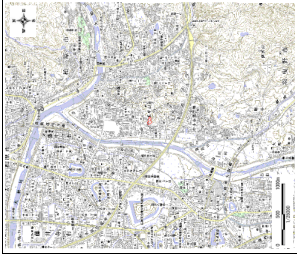
区域指定箇所概略位置図(1/25,000)