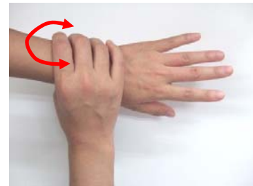
(6) 手首もねじり洗いする