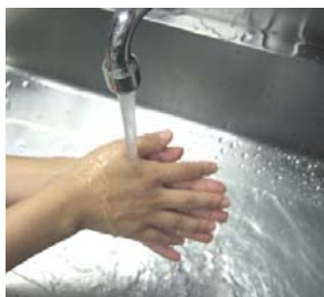
(7) 流水でせっけんと汚れを洗い流す