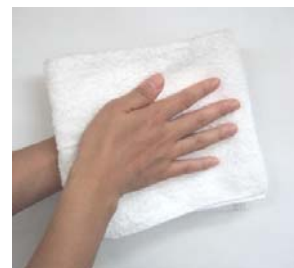
(8) タオルは使い回しをしないこと