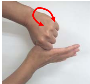
(5) 親指をねじり洗いする