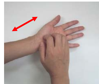
(3) 指先・爪の間をこする