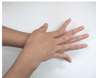
(2) 手のこうを伸ばすように