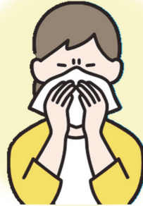
ティッシュやハンカチで 口と鼻をおおう