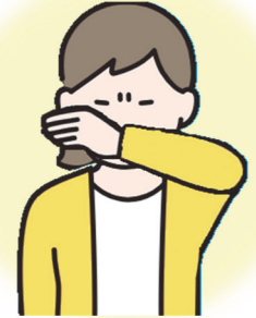
うでの うちわ 内側で 口と鼻をおおう