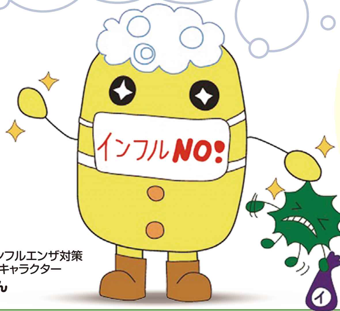
大阪府インフルエンザ対策 マスコットキャラクター マウテくん