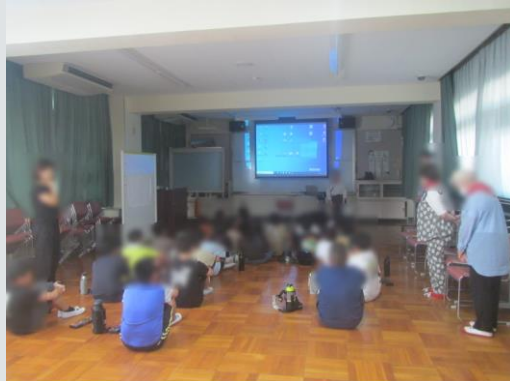
市民団体アクアフレンズより (大和川付け替えの歴史)