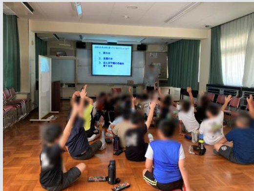
中部農と緑の総合事務所より (大和川と玉串川の水環境、玉串川の生き物)