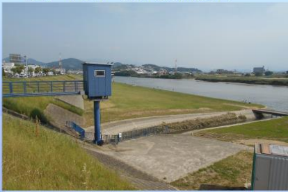
中部農と緑の総合事務所より (大和川と玉串川の水環境、玉串川の生き物)