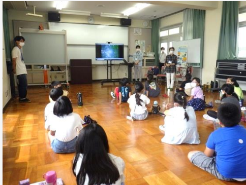
(大和川付け替えの歴史)