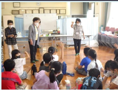
水に含まれている調味料を考えて答えを発表