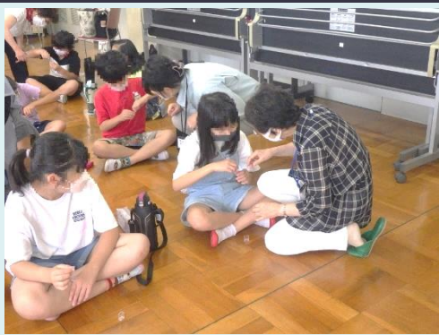
パックテストの色の変化を確認