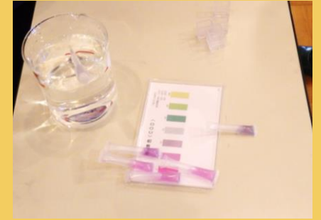
パックテストの色の変化を確認！