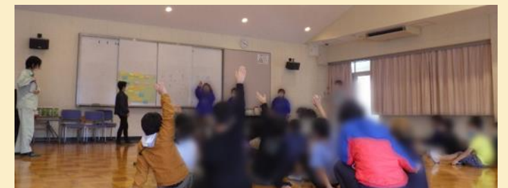
何の調味料だと思うかを発表