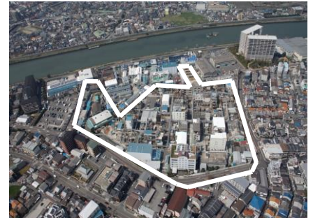
田岡化学工業(株) 本社・淀川工場

TAOKAは、暮らし・化学・環境が有機的に結びついた ハーモニックケミカルズを追求します。