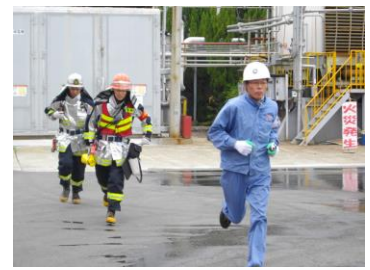
消防合同防災訓練