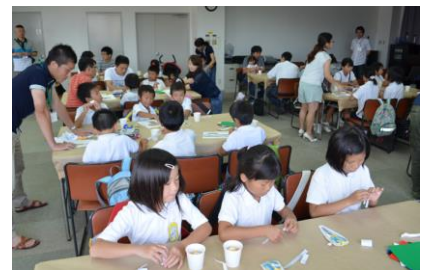
地元子供会との工作教室