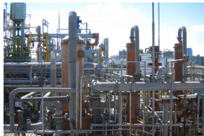
排気ガス除害設備