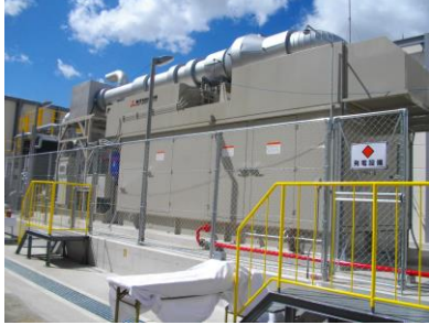
コージェネレーション設備