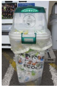
ペットボトルキャップの回収