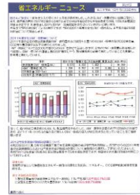
省エネルギーニュース