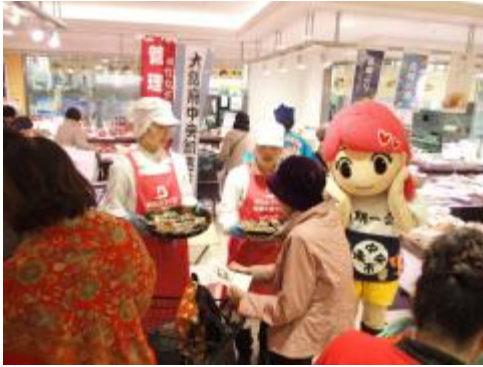
百貨店で開催した 市場まつりでの試食販売 (梅花女子大学)