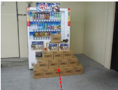
災害自販機の導入