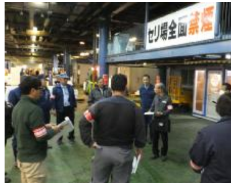
禁煙推進指導員による巡回指導