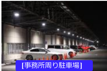
[事務所周り駐車場]