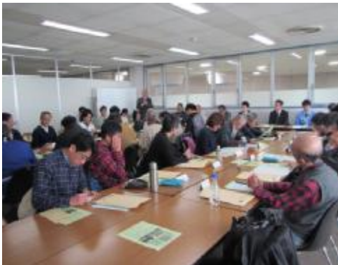
準農家向け説明会