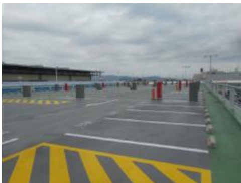
立体駐車場の塗膜防水改修工事及び区画線の引き直し (幅員2.3m→2.5m)