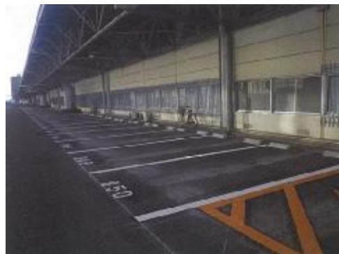
事務所周り駐車場の区画線の引き直し (幅員2.3m→2.5m)