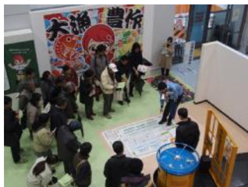
準農家向け市場見学会