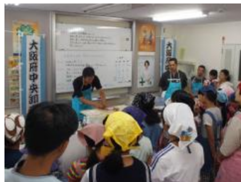
地域に出向いてのお魚料理教室