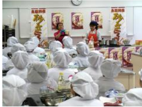
産地の協力による食育授業 (大阪成蹊大学)