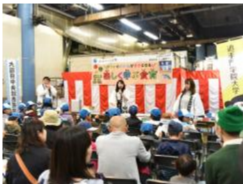
開場40周年記念市場まつりでの 模擬セリ (追手門学院大学)