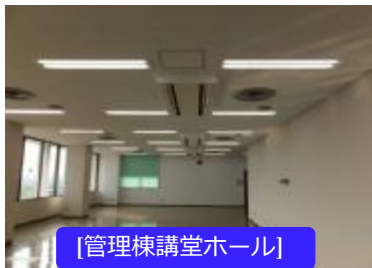
[管理棟講堂ホール]