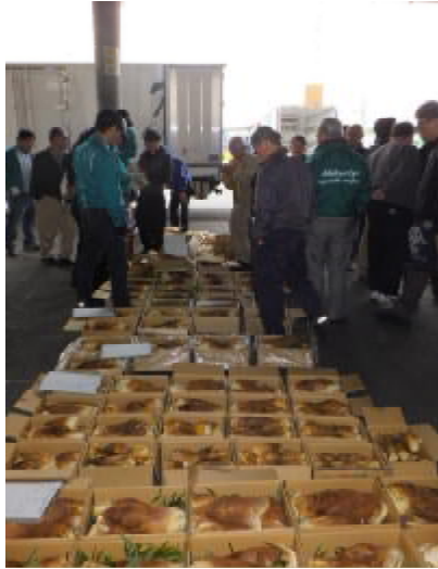
近郊売場でのせり