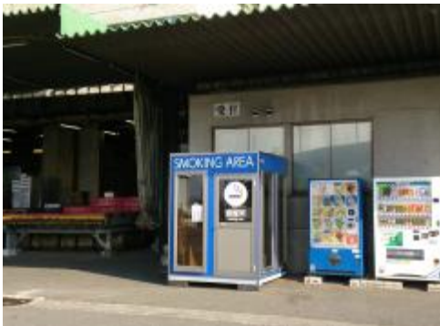
喫煙ボックスの設置