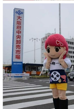
マスコットキャラクター せりちゃん