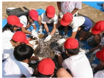
土と種や苗の支給