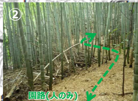
→ 山側の枯竹を境界沿いでチップper化した後、チップperを下すことができるルートを整備し、その後池周辺の竹をチップper化