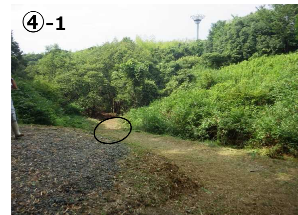
→ チップperを運搬できるように、④-1の部分は斜度が緩くなるように削る