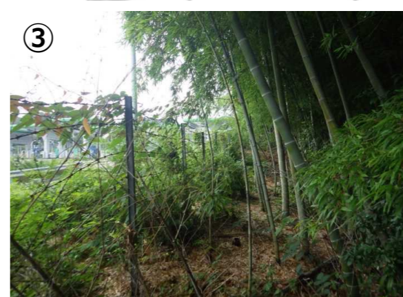
→ 高速道路への倒竹防止も兼ねて、境界沿いにチップperが通れる程度の幅の通路を整備