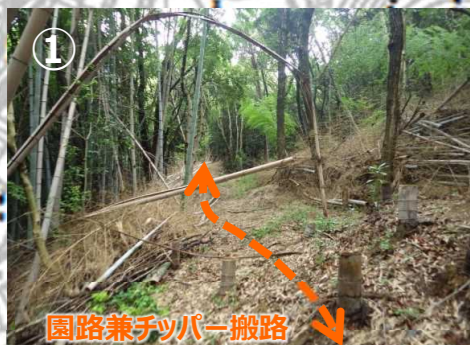
→ 現況では伐竹したものを集積している場所となっている