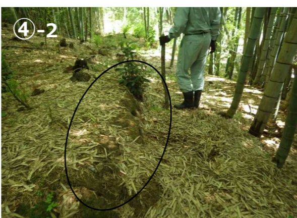
→ チップperを運搬できるように、④-2の部分は段を削って幅員を拡幅する