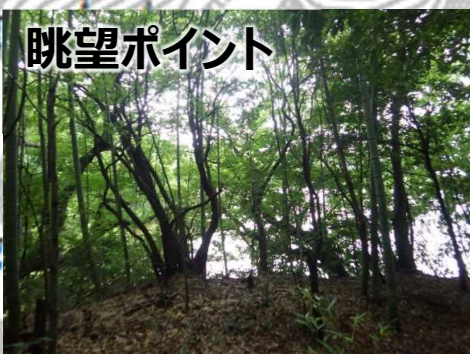
→ 竹以外の既存木も整理が必要