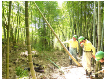
園路づくり・竹林管理