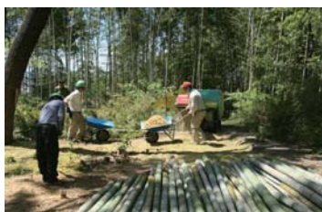
公園づくり活動の様子

泉佐野丘陵緑地パーククラブは、パークレンジャー養成講座の修了生により平成22年8月に設立された公園づくりのためのボランティア団体です。