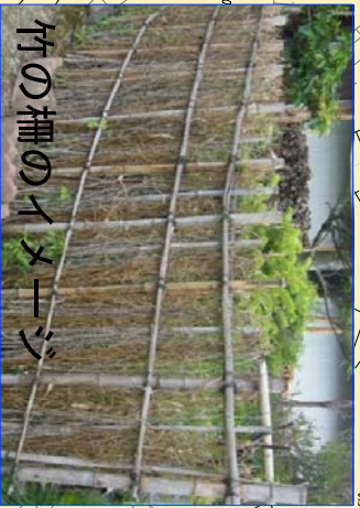
竹の柵のイメージ