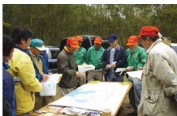
動植物調査の様子

泉佐野丘陵緑地パーククラブは、パークレンジャー養成講座の修了生により平成22年8月に設立された公園づくりのためのボランティア団体です。