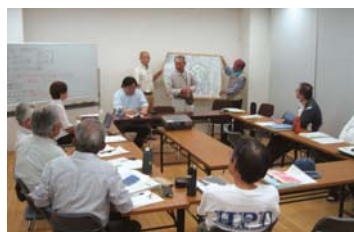
パーククラブ会議の様子