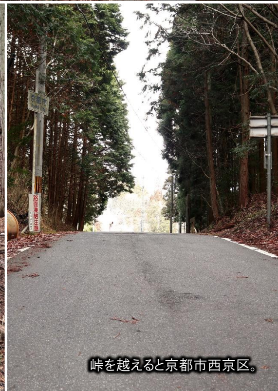
峠を越えると京都市西京区。