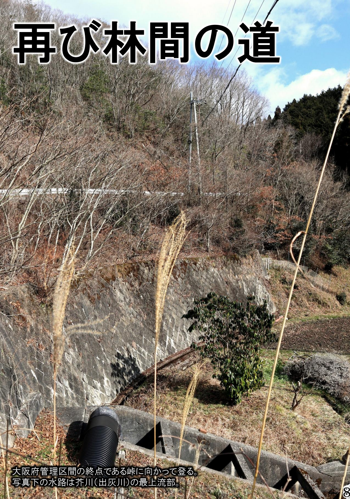
大阪府管理区間の終点である峠に向かって登る。 写真下の水路は芥川(出灰川)の最上流部。