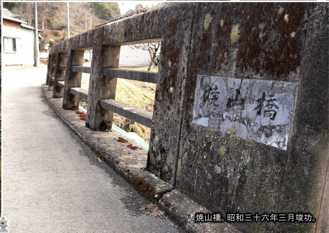
焼山橋。昭和三十六年三月竣功。