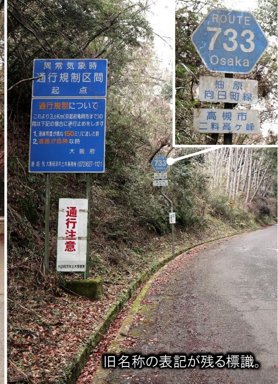
旧名称の表記が残る標識。