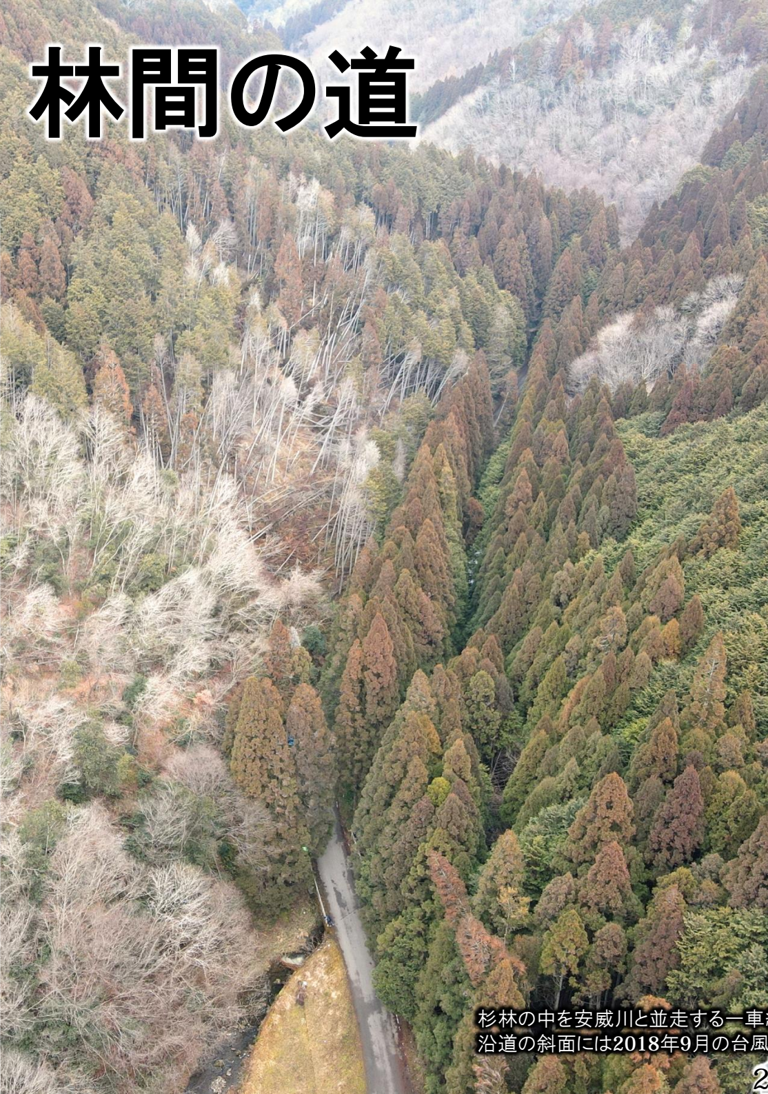
杉林の中を安威川と並走する一車線の区間。 沿道の斜面には2018年9月の台風の爪痕が残る。