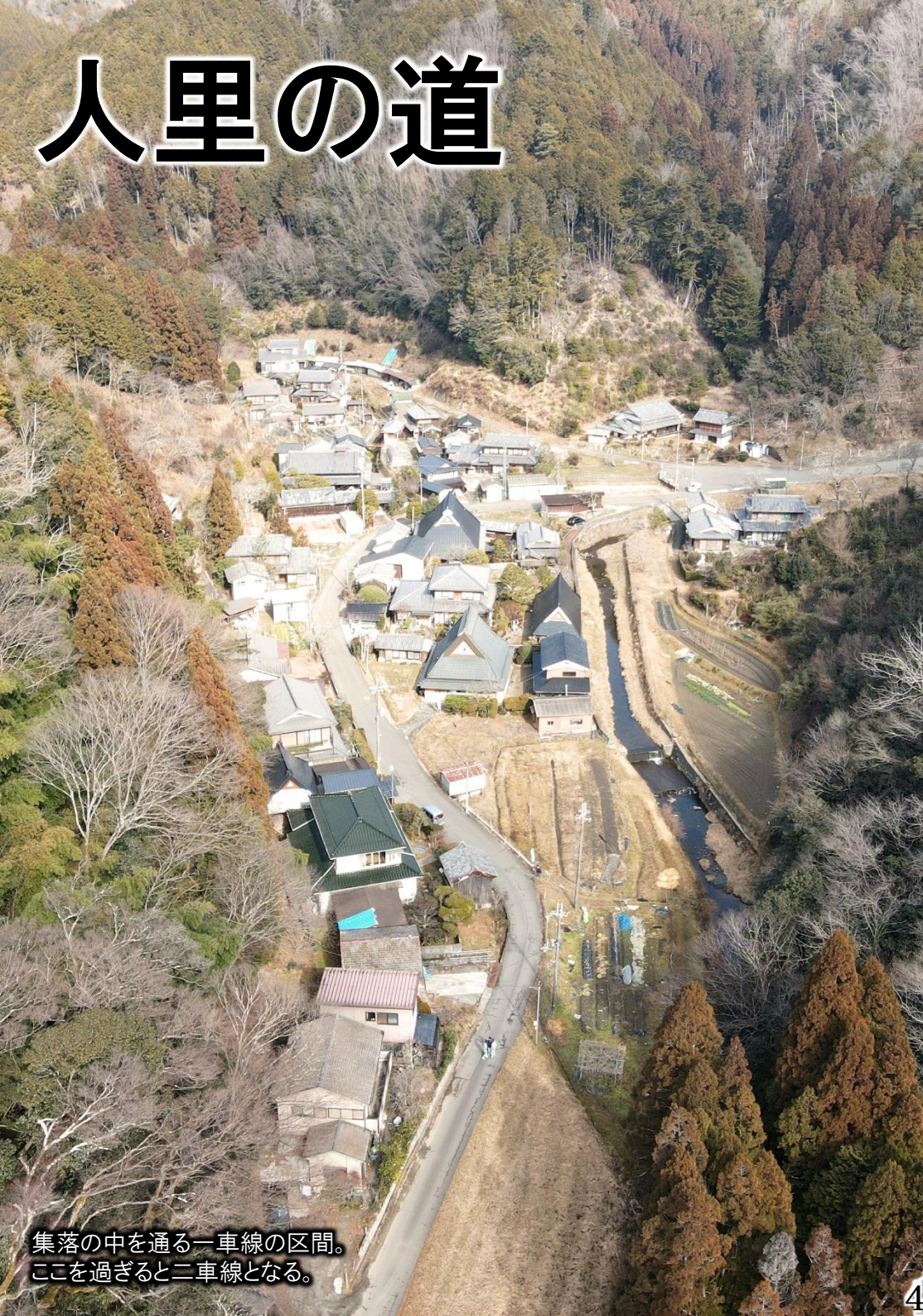
集落の中を通る一車線の区間。 ここを過ぎると二車線となる。