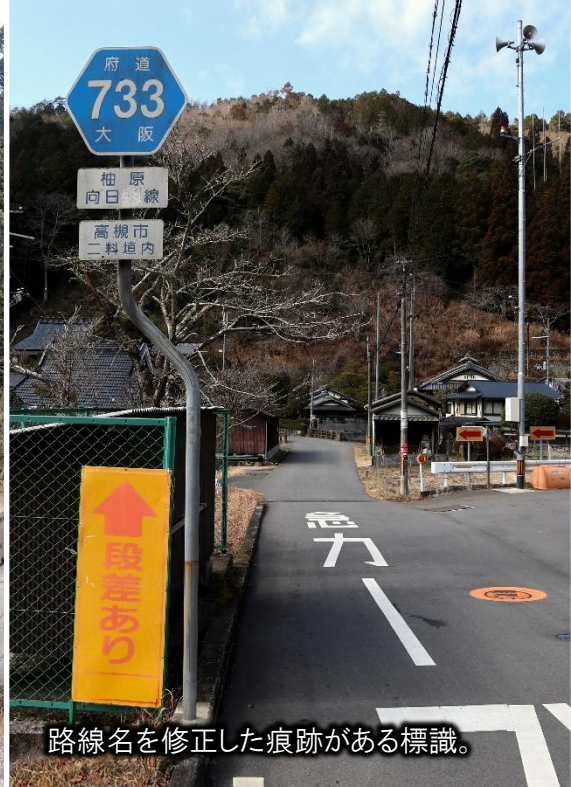
路線名を修正した痕跡がある標識。