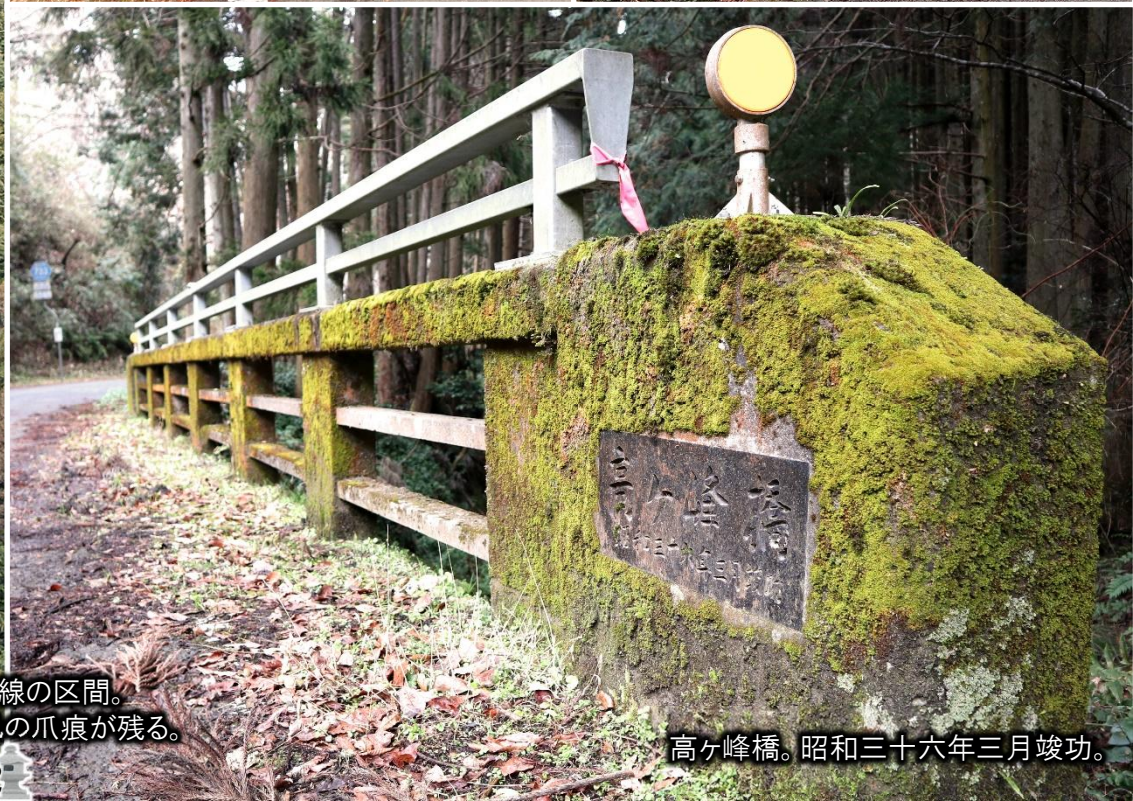
高ヶ峰橋。昭和三十六年三月竣功。