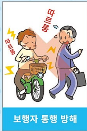
보행자 통행 방해