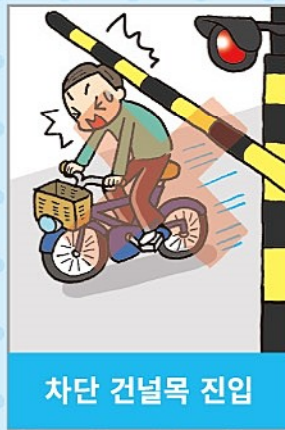
차단 건널목 진입