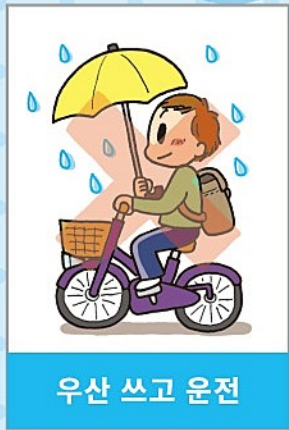
우산 쓰고 운전