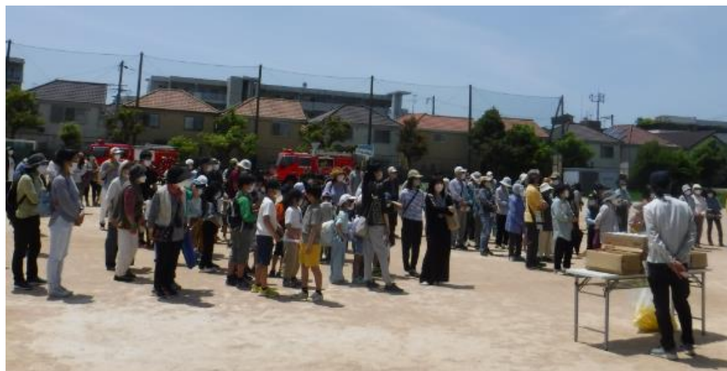
鉢塚・緑丘地区合同防災訓練