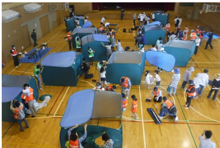
五月丘小学校区総合防災訓練