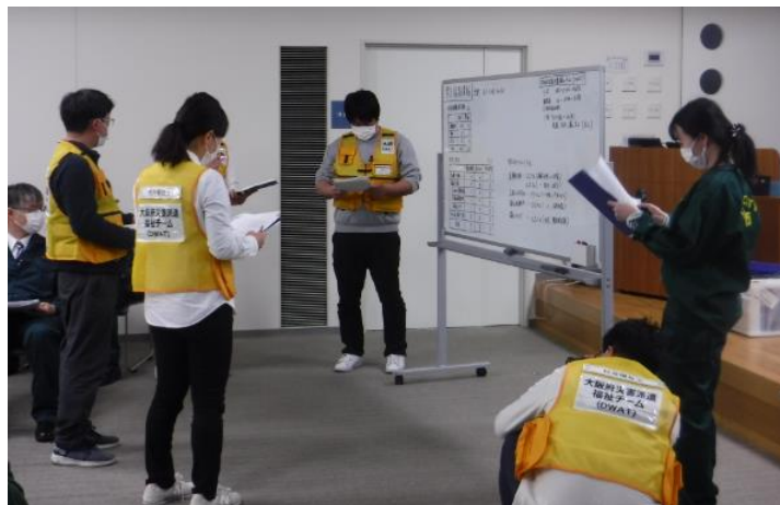
池田市防災訓練(DWATとの連携等)