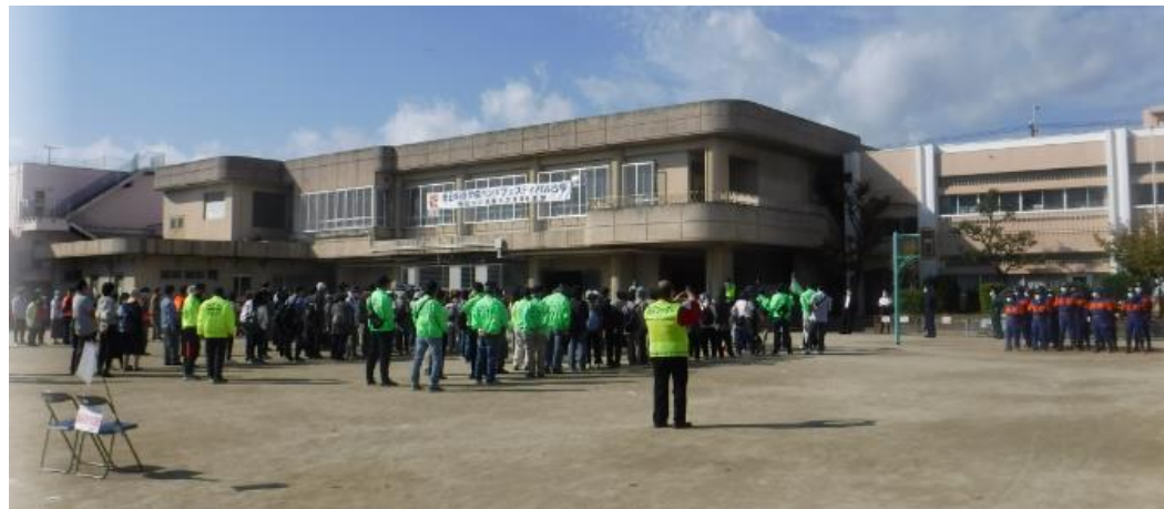
呉服校区総合防災訓練